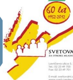
SVETOVALNI CENTER ZA OTROKE, MLADOSTNIKE IN STARŠE MARIBOR

Svetovalni center za otroke, mladostnike in starše Maribor