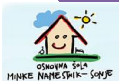
OSNOVNA ŠOLA MINKE NAMESTNIK - SONJE