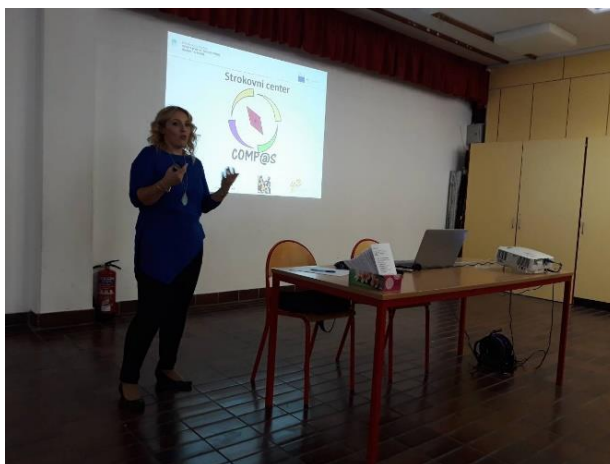
Sliki 3 in 4: Predstavitev aktivnosti projekta Comp@s na Osnovi šoli Gustava Šiliha Maribor (5. 9. 2017)