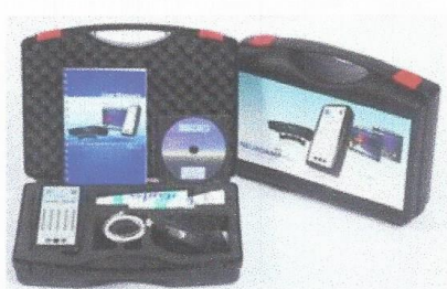
Slika 5: Bio/neurofeedback

Za delovanje strokovnega centra je vsak konzorcijski partner pridobil potrebno opremo in druga opredmetena osnovna sredstva ter izvedel investicije v neopredmetena sredstva, izmed katerih je največja pridobitev Bio/Neurofeedbacka, ki bo omogočil izvajanje bio/neurofeedback obravnave otrokom in mladostnikom s posebnimi potrebami, zlasti tistim z motnjami pozornosti in koncentracije.