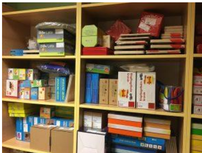
Slika 7: Knjižnica didaktičnega materiala

V namen izposoje didaktičnih pripomočkov, učil in opreme so predvidene 3 knjižnice, ki bodo na voljo podpisnikom dogovora. Do sredine oktobra 2017 je v ta namen potekala nabava prilagojenih didaktičnih pripomočkov, učil in opreme. Prva knjižnica je bila otvorjena konec novembra 2017, in sicer se nahaja na Osnovni šoli Gustava Šiliha Maribor. Izposoja je omogočena vsem ustanovam, s katerimi ima strokovni center podpisan dogovor o sodelovanju. Seznam in opis vseh didaktičnih pripomočkov, učil in opreme je dostopen na spletni strani projekta: http://sc-compas.si/izposoja-didakticnih-pripomockov-ucil-in-opreme/