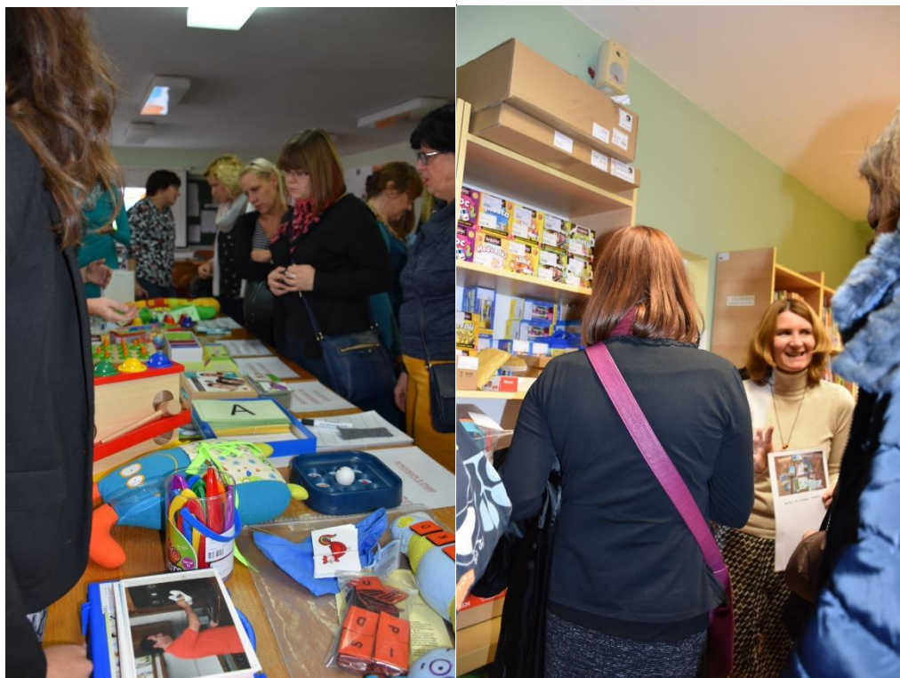
Slika 8 in 9: Otvoritev knjižnice – predstavitev didaktičnih materialov in učil