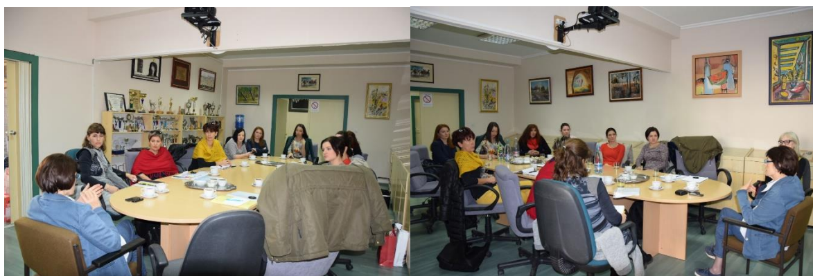
Sliki 13 in 14: Okrogla miza v Novem Sadu

Na mednarodni okrogli mizi v Novem Sadu smo si strokovni delavci projekta in strokovni delavci Strokovnega centra Milan Petrović izmenjali primere dobre prakse in spoznali strukturo delovanja sistemom inkluzije v obeh državah. Strokovni delavci projekta smo spoznali možnosti povezovanja vseh nivojev izobraževanja s področjem zdravstva in sociale ter možnosti učinkovite inkluzije oseb s posebnimi potrebami.