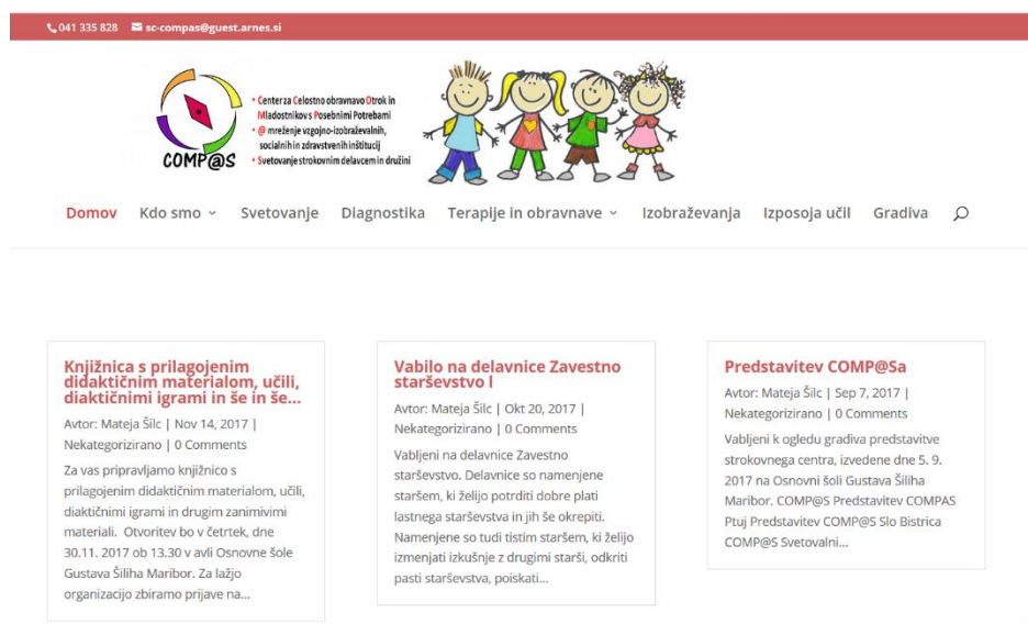
Slika 1: Spletna stran projekta Comp@s

Od konca avgusta 2018 deluje spletna stran projekta http://sc-compas.si/ , na kateri lahko zainteresirana javnost prejme ključne informacije o projektu. Na spletni strani so predstavljeni konzorcijski partnerji, seznam zaposlenih in vse storitve projekta: svetovanje, diagnostika, terapije in obravnave, seznam vseh izobraževanj, možnosti izposoja učil in gradiva.