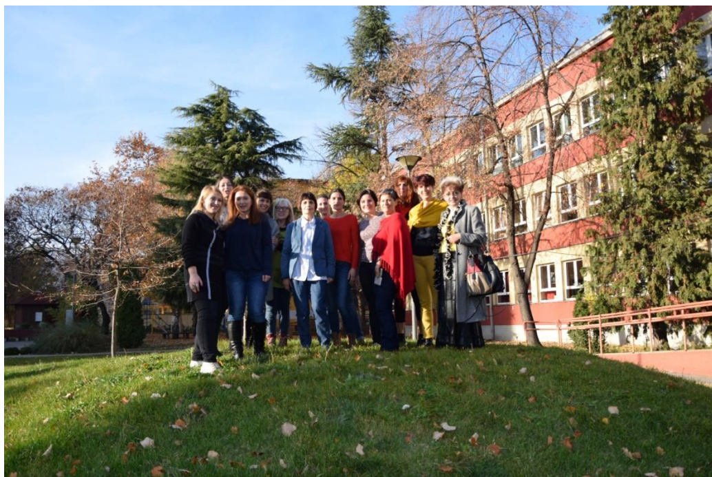
Slika 12: Udeleženci okrogle mize v Novem Sadu