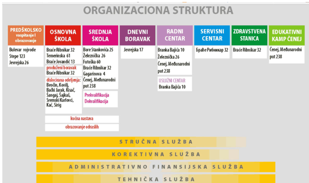
Slika 11: Organizacijska shema ŠOSO MILAN PETROVIĆ , NOVI SAD