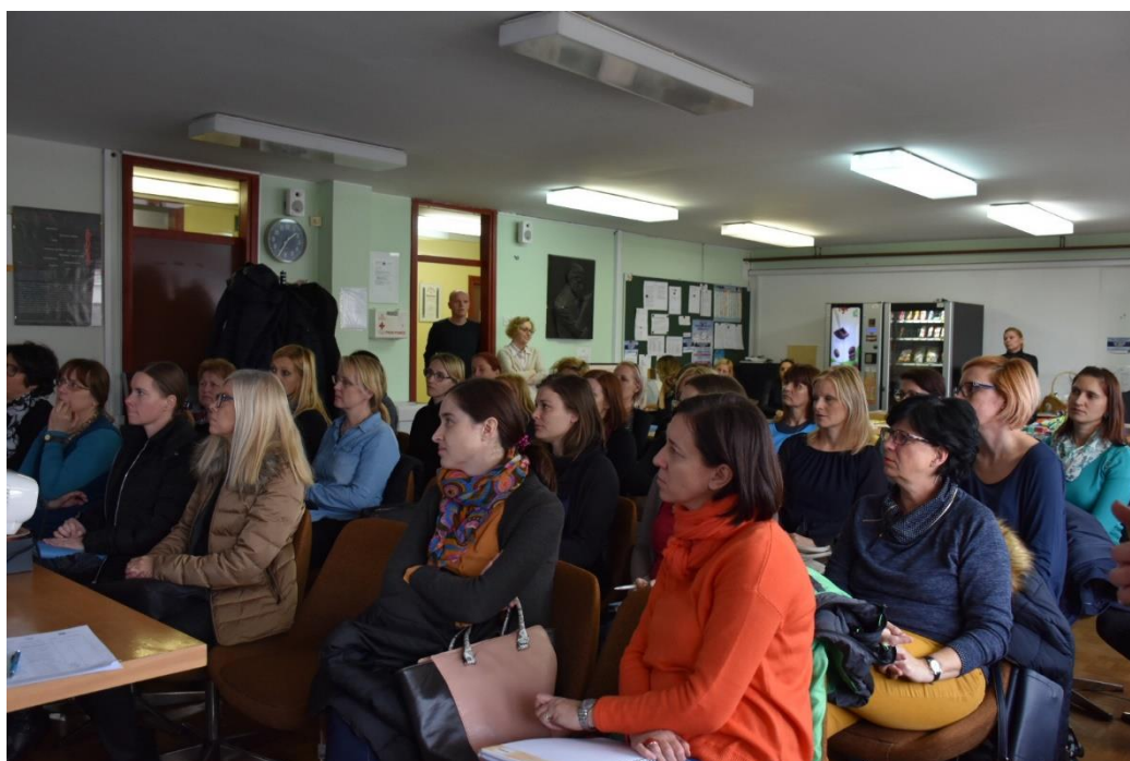
Slika 10: Okrogla miza Potrebe po prilagojenem didaktičnem materialu in učilih

Strokovni center COMP@S je del Mreže strokovnih institucij za podporo otrokom s posebnimi potrebami in njihovim družinam, ki jo v okviru javnega razpisa sofinancirata Republika Slovenija in Evropska unija iz Evropskega socialnega sklada. Operacija se izvaja v okviru Operativnega programa za izvajanje evropske kohezijske politike v obdobju 2014 – 2020, prednostna os Socialna vključenost in zmanjševanje tveganja revščine, prednostna naložba Aktivno vključevanje, tudi za spodbujanje enakih možnosti ter aktivne udeležbe in povečanje zaposljivosti. V projekt COMP@S so vključeni naslednji konzorcijski partnerji: OŠ Gustava Šiliha Maribor (poslovodeči konzorcijski partner), OŠ dr. Ljudevita Pivka Ptuj, Svetovalni center za otroke, mladostnike in starše Maribor in OŠ Minke Namestnik - Sonje Slovenska Bistrica.