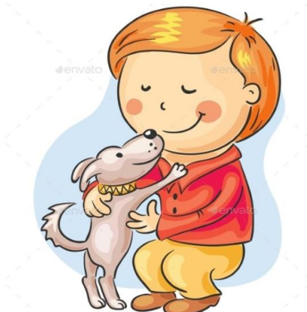
Igram se s svojim živalskim prijateljem.