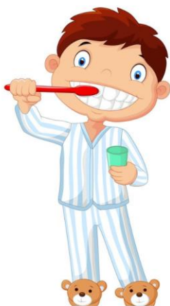
Si redno umivam zobe in skrbim za svojo higieno.