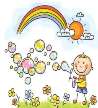
Skrbim za redno gibanje in telesno aktivnost.