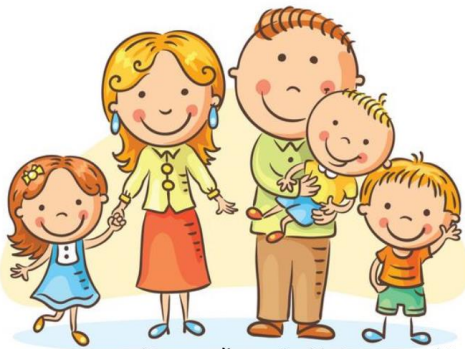
Povem svojim staršem, da jih imam rad/a.