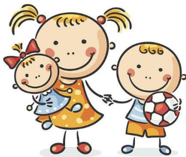
Igram se s svojim bratcem ali sestrico.