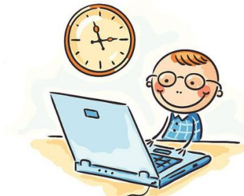
Redno opravljam šolske obveznosti.