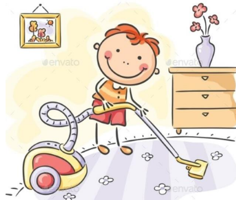
Posesam svojo sobo ali stanovanje.