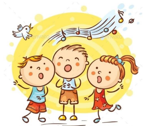
Pojem vesele pesmice.